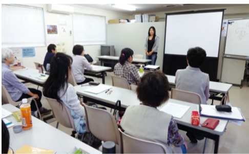
昨年の講座の様子