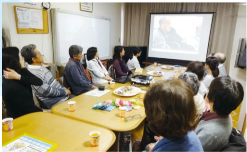
フォローアップ講座も充実!