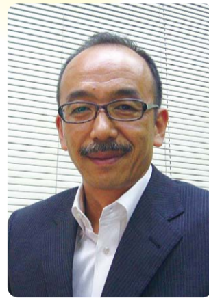
ファシリテーター