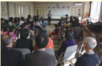
3月9日(日)に「内藤・日吉町新入学を祝う会」が開催されました。