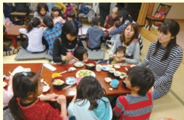
3月1日(土)に「ここねっとナインうどんDEひなまつり」を開催しました。