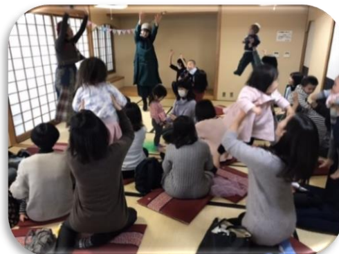
トークショーで楽しい時間を過ごせました♪

小さい子を持つお母さんが、自分のための本の時間を持てるようにするための場づくりをしています。助成金を活用して、定期的な活動をはじめトークショーなども企画することができました。初年度にもかかわらず、多くの方にご参加いただくことができました。ありがとうございました。