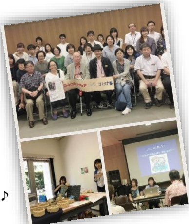
情報交換の場としてもとても充実しています♪