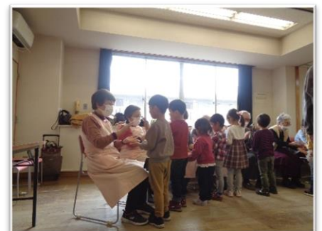
↑ 子どもたちと交流(すみれ会)