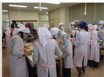
↑ 食事作りの様子(さつき会)