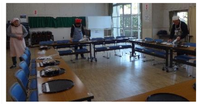
↑ 4日後の地域交流会にボランティアとして参加