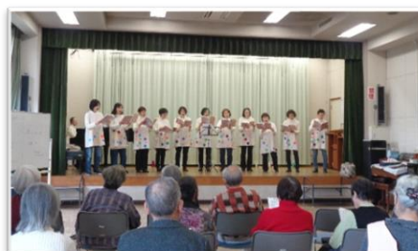
↑ イベントボランティアとの唱歌 (たちばな会)