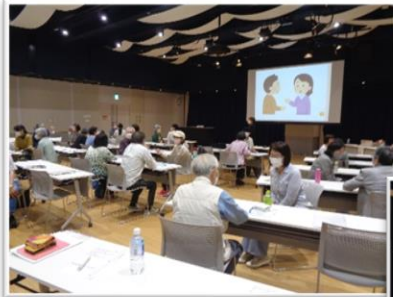
↑ 『対人関係の極意を学ぶ ボランティア講座』 →