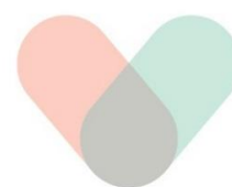
ボランティア活動センター こくぶんじ

運営委員会では、地域を知り活動のきっかけにしてもらうために、平成26年度よりシンポジウムを毎年、合計10回開催しました。シンポジウムでは、社会の課題を広く啓発し、ボラセンの存在を市民に知らせ、より多くの方が地域や社会に参加する取組みを進めてきました。