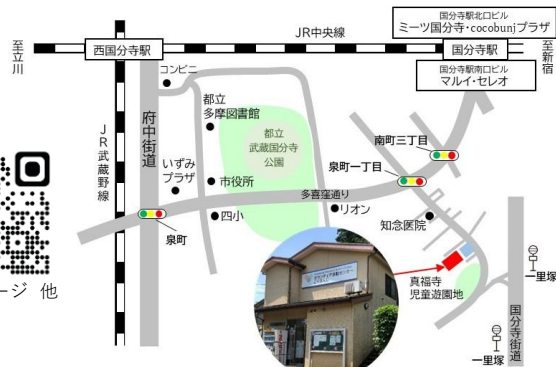
ボランティア活動センターこくぶんじ