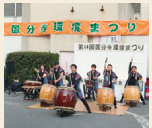
武州太鼓団によるイベントの様子

自分の得意なこと・好きなことが、人の為、地域の為に役に立つ、たくさんの方に喜んでいただけるということで、やりがいがあります。ぜひ、自分の得意なことを生かして、地元から元気を発信しましょう♪