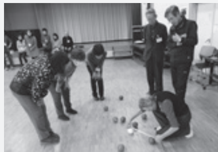
ボッチャを行う様子