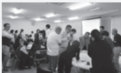
10月26日 グループワークの様子

今回の学習会に参加してくださった方はもちろんのこと、初めての方も、ぜひ、お待ちしております。(詳しくは、ふくしの1ページをご覧ください。)