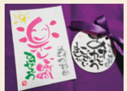
訪問した施設には「伝筆」によるメッセージをプレゼントしています。