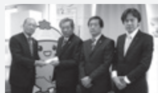
公益社団法人 東京都宅地建物取引業協会 国分寺国立支部様