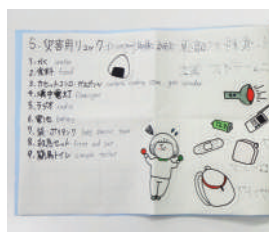
「君の危険性を食べたい。 I want to eat your risk」 国分寺立第三中学校 外国人向けのマップ（国立駅）