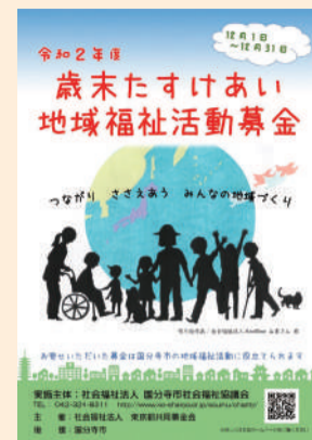
ポスター作成協力：社会福祉法人 AnnBee 様