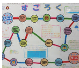
「中学生が考える小中学生のためのマップ」 国分寺立第二中学校 七小、二中生から アンケートをとる・ 避難所で使えるように マップに工夫