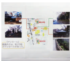
「知っておこう！台風時の危険」 国分寺立第四中学校 意外と知らない四小・四中周辺の 危険な場所