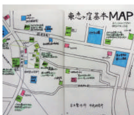
「日常生活に溶け込んだ防災意識」 国分寺立第一中学校 東恋ヶ窪地域に特化した地図・ 普段の時の地図と緊急時の 地図の比較

こでこの防災マップの成果を少しでも多くの方に見ていただきたいと思い、小冊子を作成することになりました。来年2月末に完成予定です。各生徒の思いや、マップづくりでこだわったことなども盛り込んだ冊子にと、準備を進めているところです。どうぞお楽しみに。