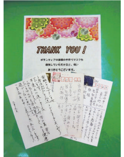
手作りマスクを受取った方からのお礼のはがき

協力したい方や詳細についてはボラセンのホームページをご覧ください。お電話（042-300-6363）にてお問い合わせください。