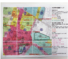
「火災時の避難マップ」 早稲田実業学校中等部 ～大きな地震の後に 起きる火災からいかに身を守るか～