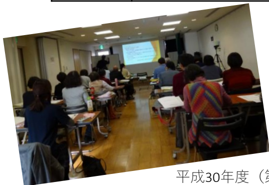
平成30年度（第一期）養成講座の様子