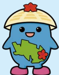
マスコットキャラクターふくすけ

編集発行/社会福祉法人国分寺市社会福祉協議会 https://www.ko-shakyo.or.jp