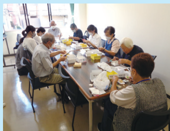
国分寺市寿奉仕団(切手整理)

4時間半のボランティアを最初は「長いな」と思っていたけれど、作業をしていくにつれてだんだんやりがいが出てきて早く終わった。とても良い経験だった。 (児童館活動参加の高校生)