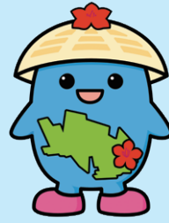
マスコットキャラクターふくすけ

「ふくしのつどい」とは…誰もが安心して暮らせるまちづくりへの理解と参加を促進するとともに、地域福祉の発展に多大なる功績のあった個人および団体を表彰し、感謝を表すイベントです。