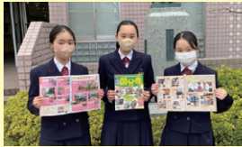
早稲田実業学校中等部 3年生