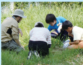
武蔵国分寺公園(外来種の除草)

この施設の存在と活動内容を、もっと市民が知るべきと感じた。職員の方も通所されている方もとても優しい方ばかりで、お手伝いしやすかった。時間も短くあまり役立てなかったのも、また近々ボランティアに伺いたい。 (障害者施設で活動の成人)