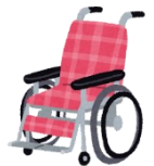
車いすステーション一覧