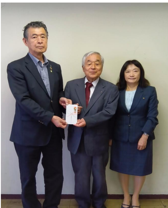
【東京武蔵国分寺ロータリークラブ 様】