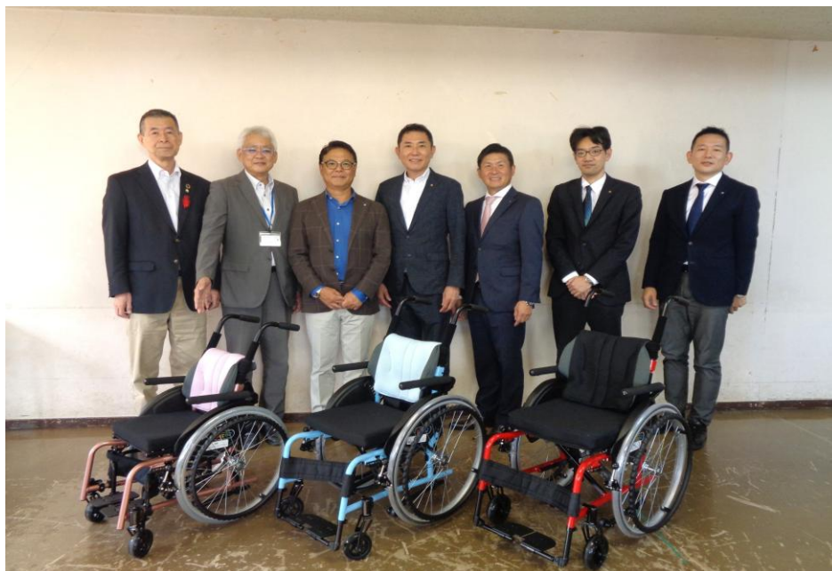
【東京国分寺ロータリークラブ 様】