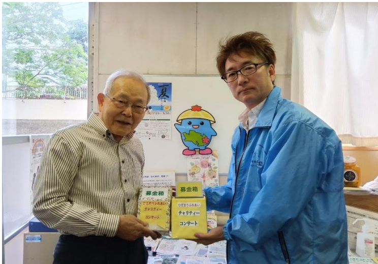
【ひだまりふれあいチャリティコンサート実行委員会 様】