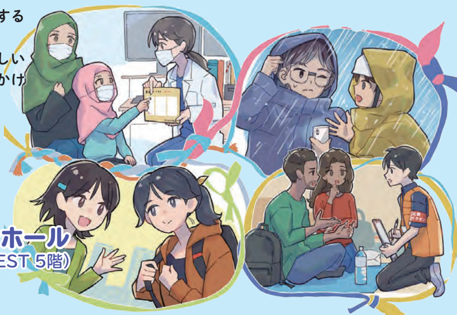
イラスト:ワカめかり