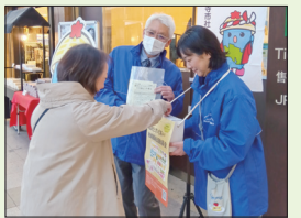
令和7年12月1日 国分寺駅にて街頭募金を実施