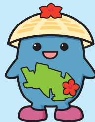
マスコットキャラクターふくすけ