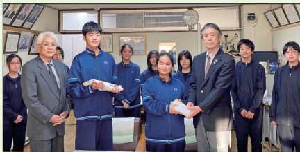
第二中学校生徒会役員より募金のお預かり