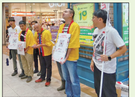
令和7年10月1日 国分寺駅にて街頭募金を実施