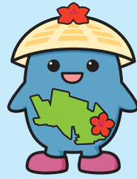
マスコットキャラクターふくすけ